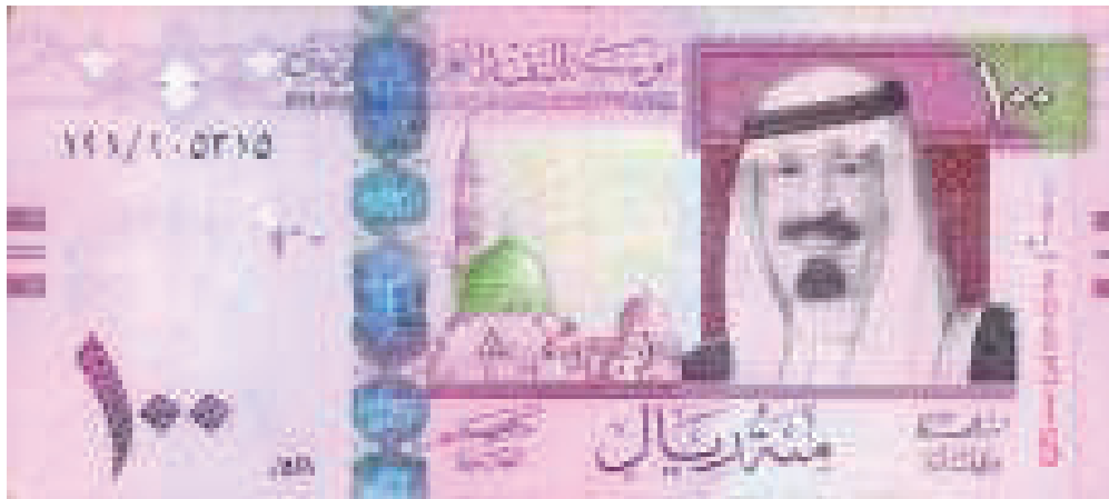
Contoh Mata Uang 100 Real Baru