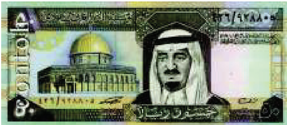
Contoh Mata Uang 50 Real Lama