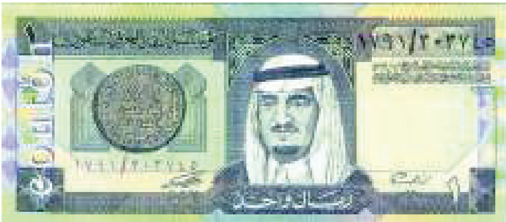
Contoh Mata Uang 1 Real Lama