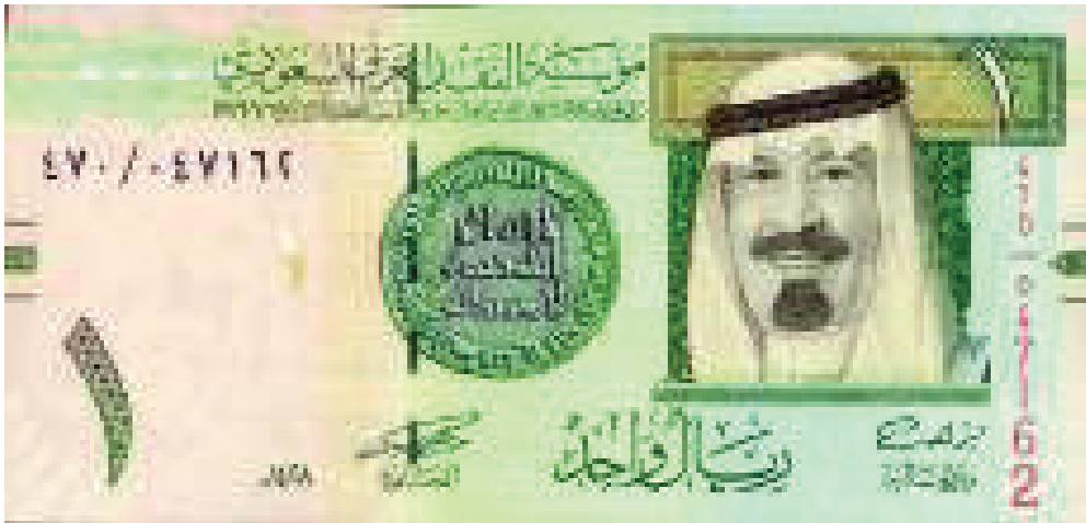
Contoh Mata Uang 1 Real Baru