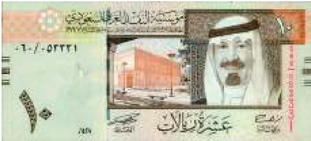
Contoh Mata Uang 10 Real Baru