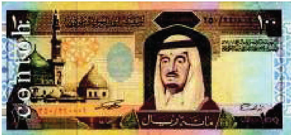
Contoh Mata Uang 100 Real Lama