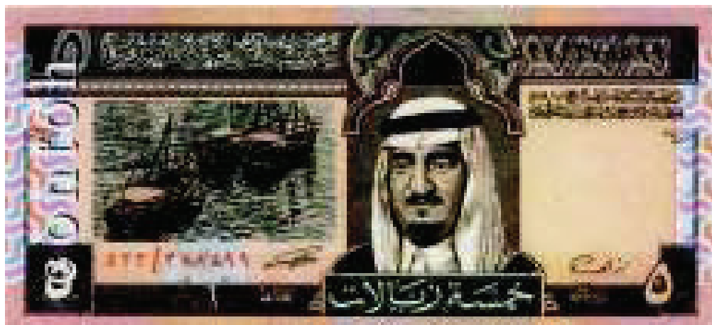
Contoh Mata Uang 5 Real Lama