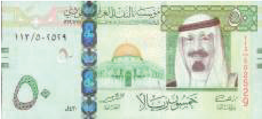
Contoh Mata Uang 50 Real Baru