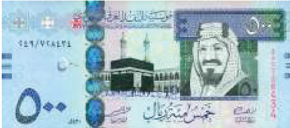
Contoh Mata Uang 500 Real Baru