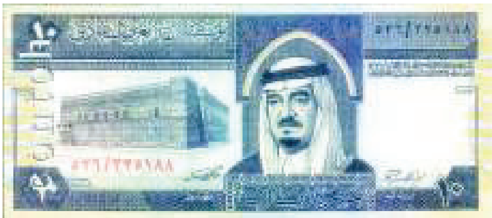
Contoh Mata Uang 10 Real Lama