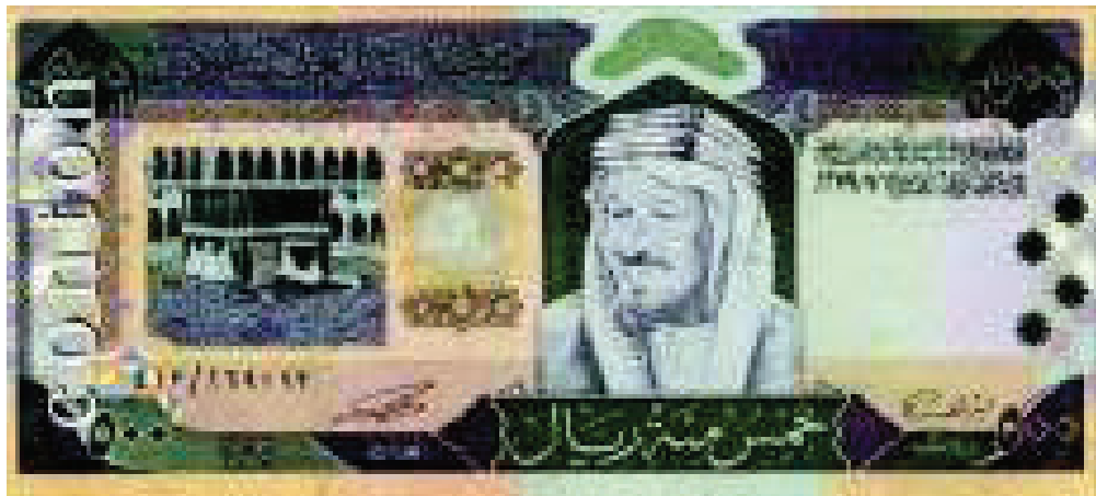
Contoh Mata Uang 500 Real Lama