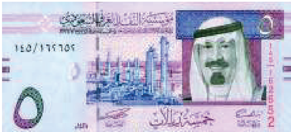
Contoh Mata Uang 5 Real Baru