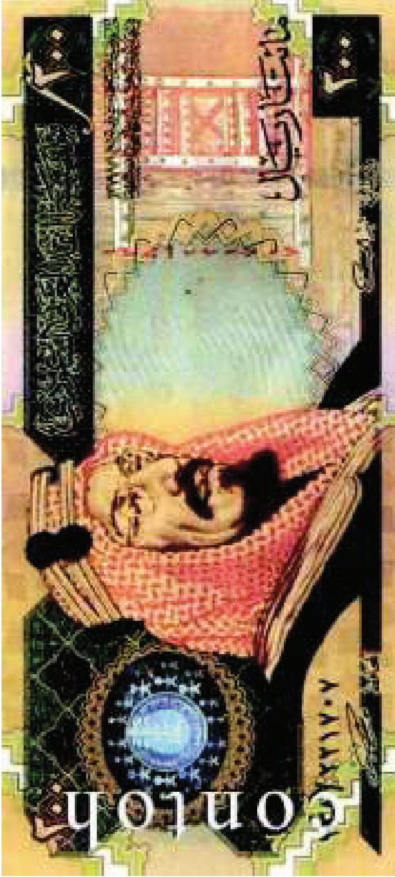
Contoh Mata Uang 200 Real