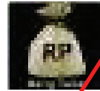
Perhiasan & uang tunai yang berlebihan